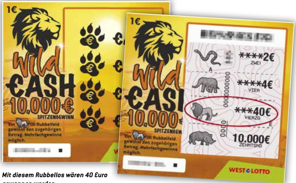
Mit diesem Rubbellos wären 40 Euro gewonnen worden.