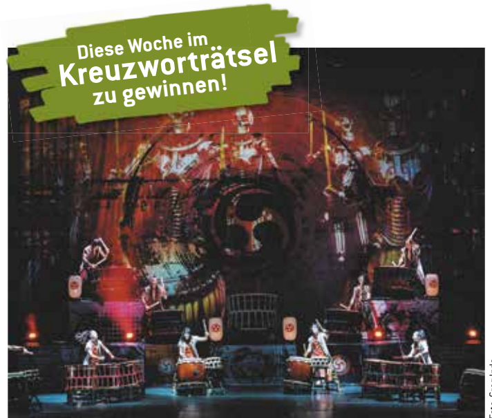
„YAMATO - THE DRUMMERS OF JAPAN“ sind in Nordrhein-Westfalen nur in Düsseldorf und in Duisburg zu erleben.

Fische (20.2. – 20.3.) Bleiben Sie bodenständig und schauen Sie, ob sich eine Aufgabe noch etwas besser bearbeiten lässt als bisher. Seien Sie offen für Ideen. Glückstag: Mittwoch