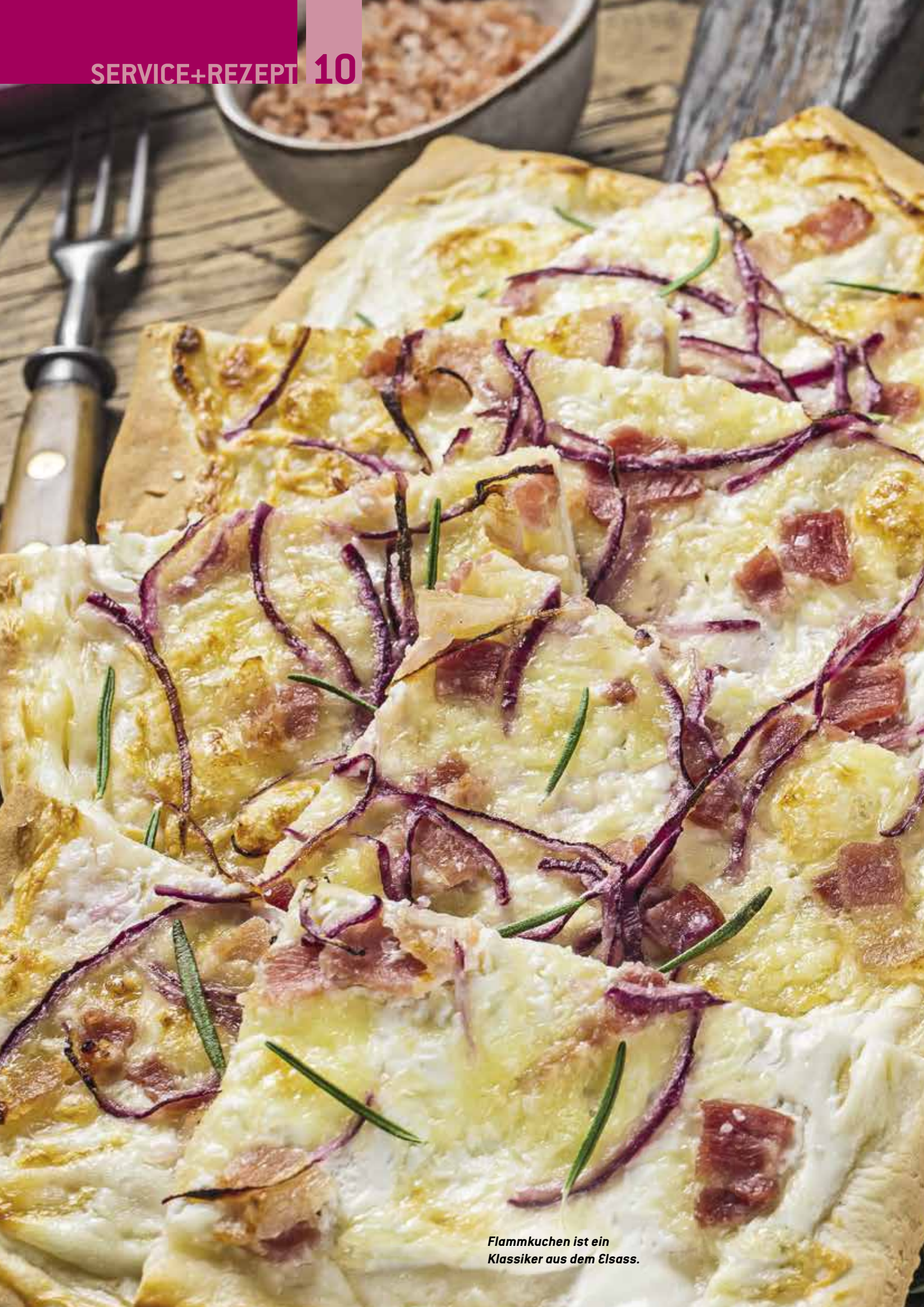
Flammkuchen ist ein Klassiker aus dem Elsass.