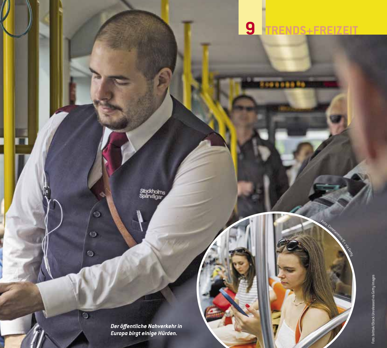
Der öffentliche Nahverkehr in Europa birgt einige Hürden.

schen vier und sechs Euro in Bus, Tram oder Metro.