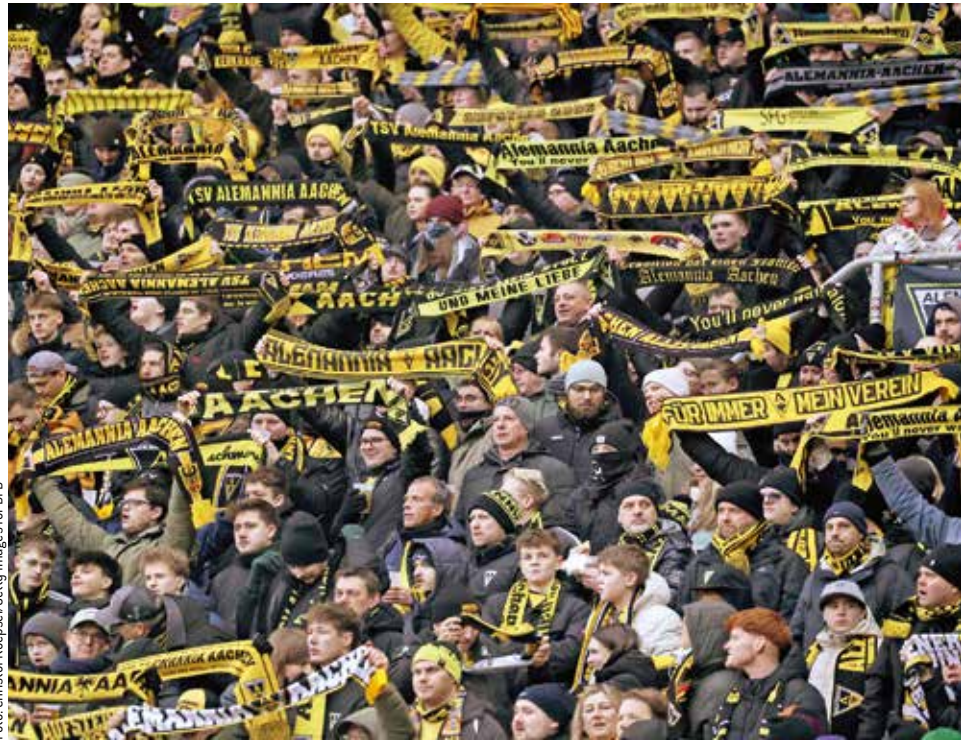
In den Stadien – das Bild zeigt Fans von Alemannia Aachen – spiegelt sich die positive Entwicklung der 3. Liga wider: In der vergangenen Saison wurde ein neuer Zuschauerrekord erzielt.