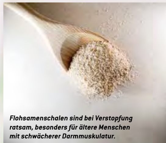
Flohsamenschalen sind bei Verstopfung ratsam, besonders für ältere Menschen mit schwächerer Darmmuskulatur.

Bei entzündlicher Arthrose kühlt Kohl. Dem ZQP zufolge kann man eine Auflage damit bis zu zweimal täglich anwenden, jeweils mit fri-